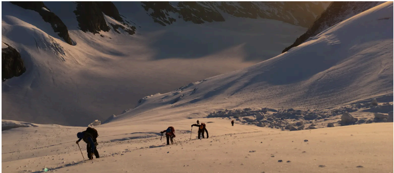
Alpinistas durante la última parte del ascenso a la Dôme des Ecrins 4015 m.

Una larguísima y preciosa bajada de 1500 metros nos espera hasta el refugio du Glacier Blanc , donde pasaremos nuestra última noche.